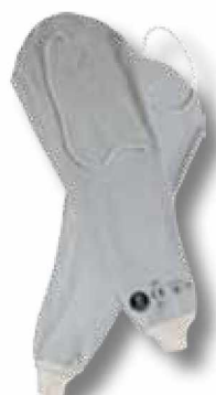
R41 Manguitos largos hasta el hombro.