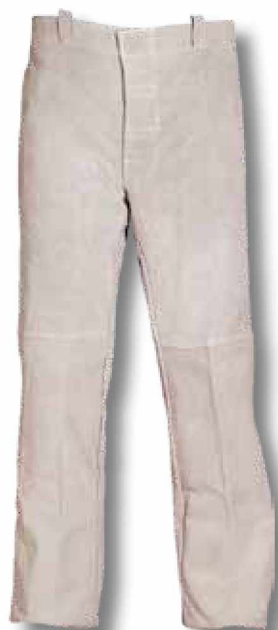
R71 Pantalón de cuero serraje.