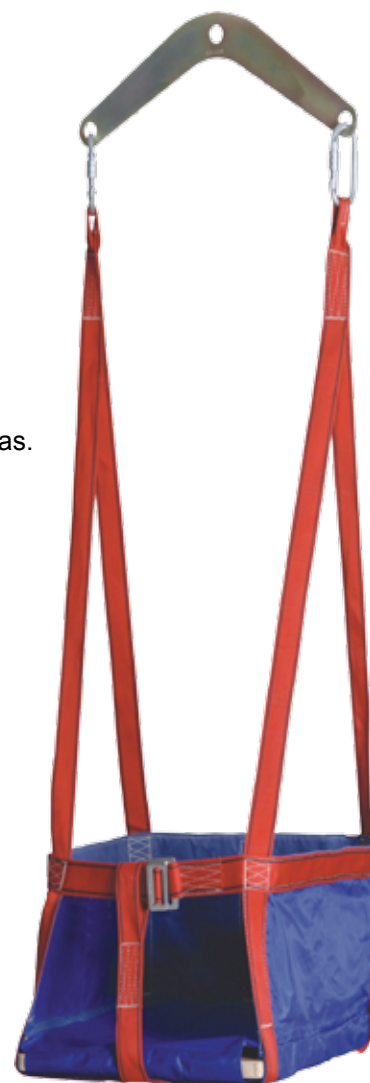
D90A MIRA SIT con placa de elevación.

Los asientos para suspensión permiten desempeñar trabajos estáticos en altura con total comodidad y seguridad.