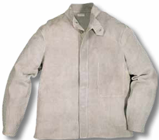
R61 Chaquetón de cuero serraje.