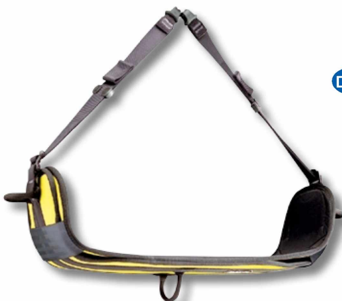
D90 Asiento PODIUM.