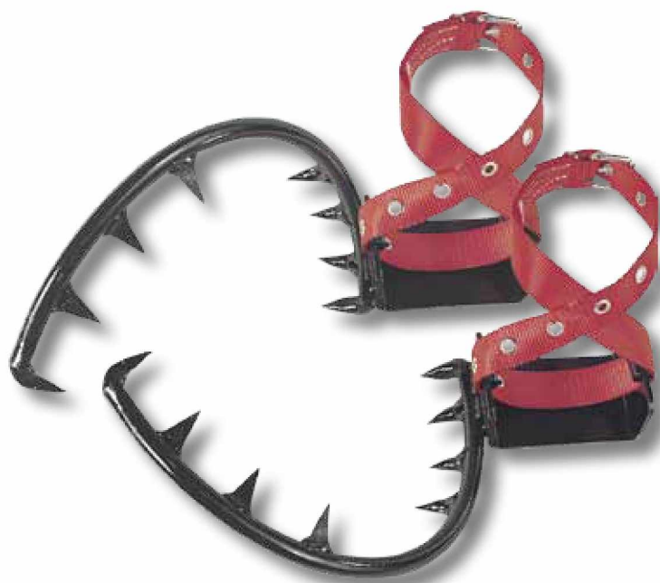
T10 Juego de trepadores.