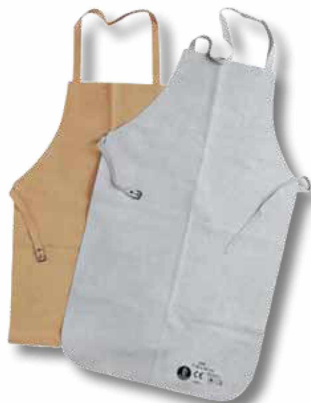
R30 Mandil de cuero serraje 60 x 90 cm.