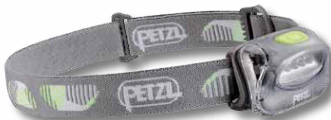
D294 Linterna TIKKA 2 Core