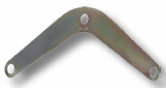
Placa de elevación y descenso.

Los asientos para suspensión permiten desempeñar trabajos estáticos en altura con total comodidad y seguridad.