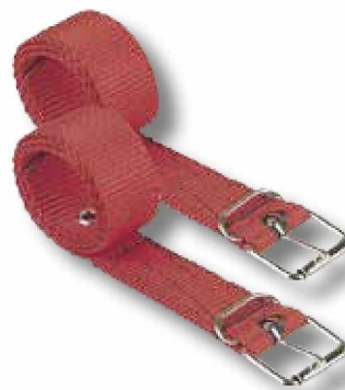
T11 Juego de correas de cinta para trepador.