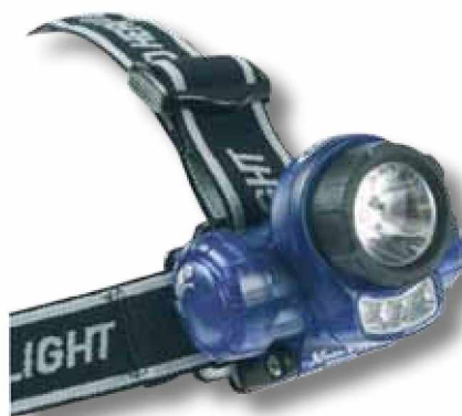
D2940 Linterna HEADLIGHT