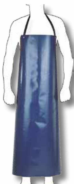
R36 Mandil PVC 75 x 100 cm.