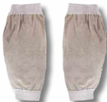
R40 Manguitos cortos hasta el codo.